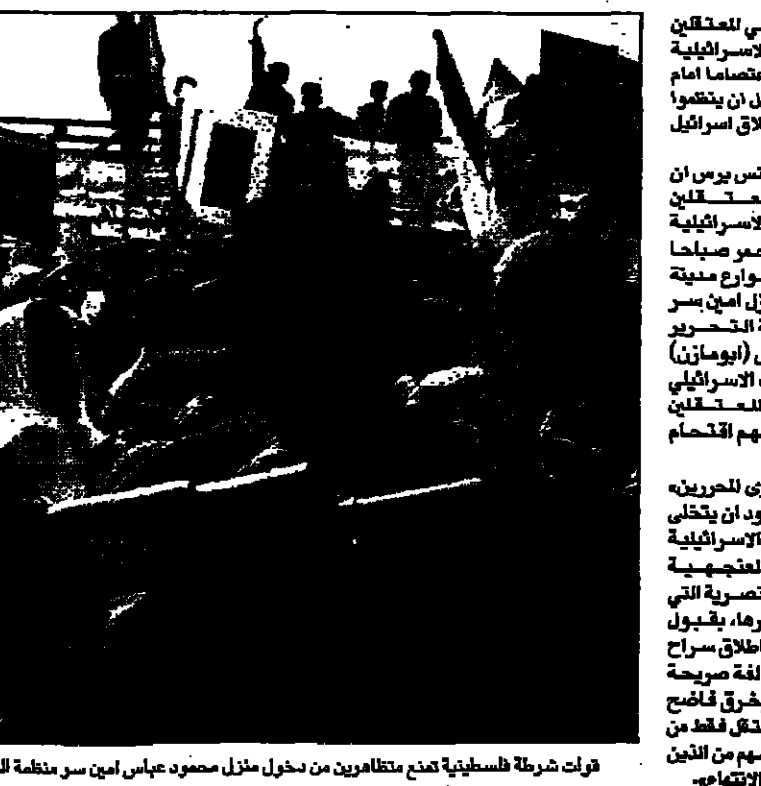
قوات شرطة فلسطينية تحت مظلة حرم عباس امين سر منظمة التحرير الفلسطينية في غزة